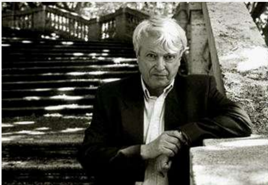
Predrag Matvejevic (Mostar, 1932)

"la mente non è un vaso da riempire, ma come fa legna da ardere, ha solo bisogno di una scintilla che l'accenda e le dia l'impulso per la ricerca, e un amore ardente per la verità"