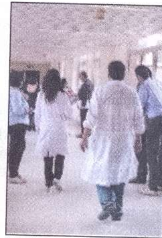
Medici in corsia

Stamattina il pm Cutroneo affiderà l'incarico al medico legale, che nella stessa giornata di domani effet-