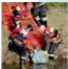
Il recupero di un suicida

Crisi e suicidio, disoccupazione e depressione. Da quando l'economia porta davanti il segno meno, sono in consistente aumento gli stati d'ansia e le depressioni: i primi hanno fatto registrare un più 30 per cento, le seconde un più 15. Crisi e patologie depressive corrono di pari passo: più aumentano i problemi economici, tanto più s'impennano gli stati depressivi. Ed il rischio che sfocino in suicidi cresce.